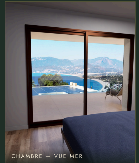
CHAMBRE — VUE MER