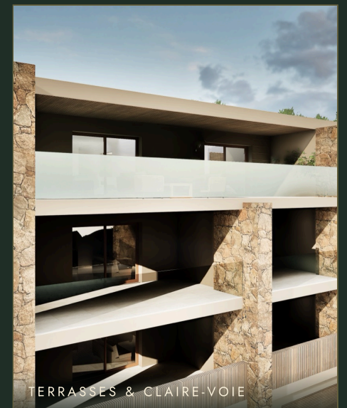
TERRASSES & CLAIRE-VOIE