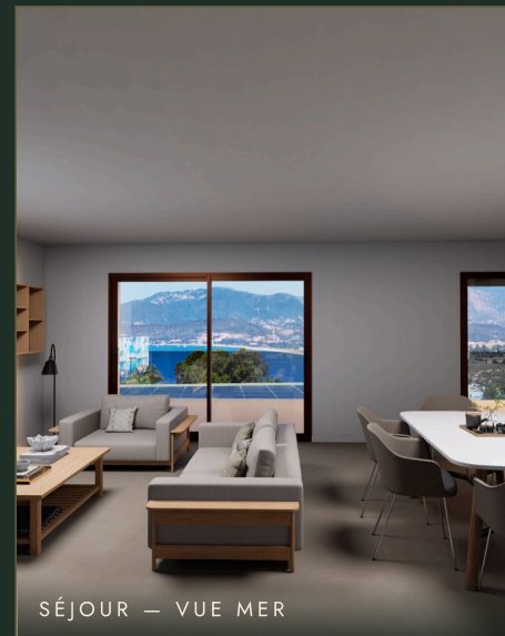
SÉJOUR — VUE MER