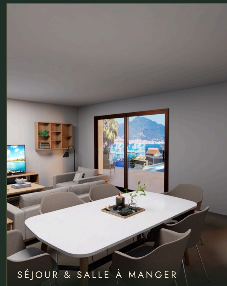
SÉJOUR & SALLE À MANGER