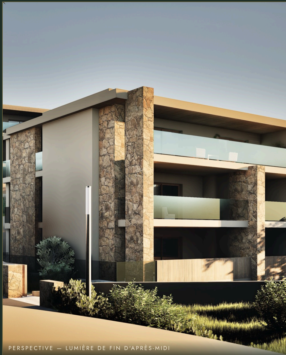
PERSPECTIVE — LUMIÈRE DE FIN D'APRÈS-MIDI